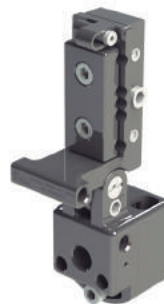
FIXADOR DINÂMICO DE EXTREMIDADE LINEAR 009.181.125