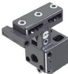
FIXADOR DINÂMICO DE EXTREMIDADE CONVERGENTE 009.103.066