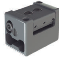
FIXADOR RÍGIDO BIANGULAR 009.095.058