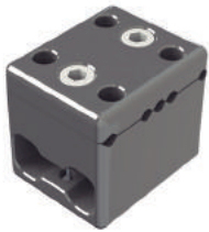
FIXADOR RÍGIDO SIMPLES 009.090.053