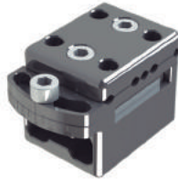
FIXADOR DINÂMICO DE ROTAÇÃO 009.092.055