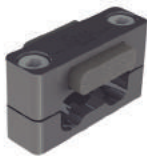
APOIO FLEXÍVEL PARA FIXADORES 009.130.093