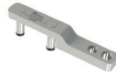
ALAVANCA PROLONGADORA - FIXADOR DINÂMICO DE EXTREMIDADE DE TRILHO 009.102.065