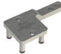
ALAVANCA PROLONGADORA - FIXADOR DINÂMICO DE ROTAÇÃO 009.101.064