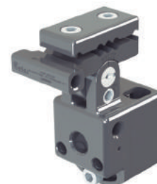
FIXADOR DINÂMICO DE EXTREMIDADE EM T 009.096.059