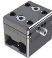
FIXADOR DINÂMICO DE TRANSLAÇÃO 009.091.054