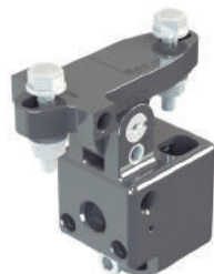
FIXADOR DINÂMICO DE EXTREMIDADE PARA ANEL 009.093.056