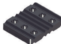
PLACA INTERMEDIÁRIA BIPLANAR 009.061.024